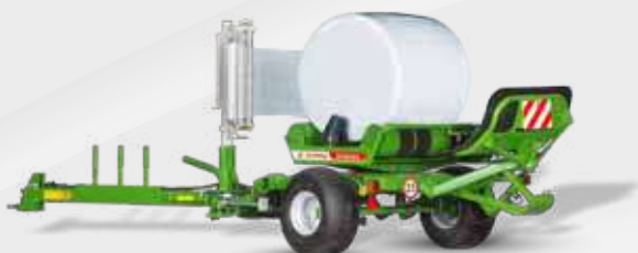
SIPMA OS 7650 GAJA

SIPMA OS 7530 MAJA SIPMA OS 7531 MAJA SIPMA OS 7650 GAJA SIPMA OR 7532 DIANA SIPMA OG 9750 LENA