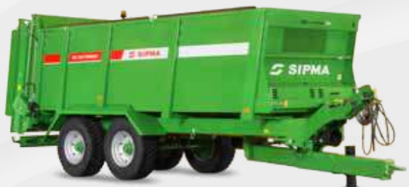
SIPMA RO 1200 TORNADO

Разбрасыватели органических удобрений SIPMA RO 1200 TORNADO и SIPMA RO 1400 TORNADO предназначены для разбрасывания навоза, торфа, компоста, куриного помета и извести. Разбрасыватели отличаются прочной конструкцией и большой грузоподъемностью.