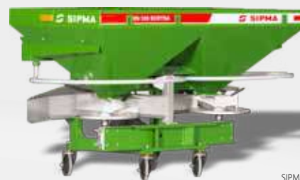
SIPMA RN 500 BORYNA

SIPMA является одним из ведущих производителей разбрасывателей минеральных удобрений, и неустанно работает над повышением точности высева и получением более широкой рабочей ширины в своих продуктах. С этой целью, в одном из самых современных посевных помещений в Европе, оборудованном высокотехнологичным измерительным оборудованием, в течение года проводятся исследования. Результатом этой работы являются постоянно актуализированные высевные таблицы для всех появляющихся на рынке удобрений.