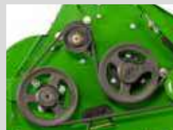
КЛИНОВЫЕ РЕМЕШКИ (СЕРИЯ ATLAS)

ДВА СПОСОБА ПЕРЕДАЧИ ПРИВОДА МЕЖДУ РАБОЧИМИ ВАЛИКАМИ