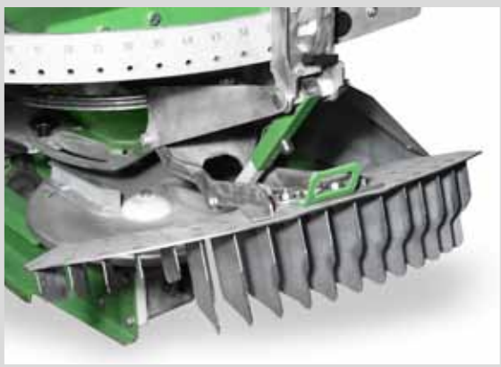
СИСТЕМА ГРАНИЧНОГО ВЫСЕВА LIMES

обеспечивает рассеивание навоза на краю поля, в соответствии с нормативными документами о правилах внесения удобрений, обеспечивая правильную дозировку удобрений до самой границы поля и исключает экономические потери, возникающие в результате избыточного внесения удобрений или их разбрасывания на соседние поля. Используется, когда первая технологическая колея лежит в середине рабочей ширины рассеивателя. Изготовлена из нержавеющей стали.