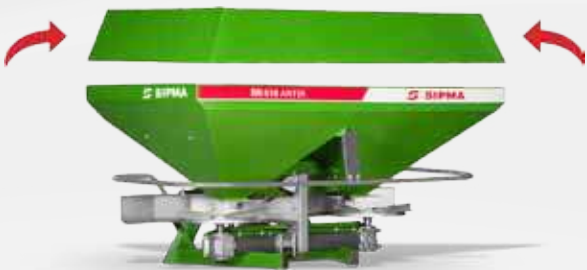
SIPMA RN 610 ANTEK И НАДСТАВКА

легко устанавливаются на основном бункере, позволяют регулировать ёмкость бункера и обеспечивают рациональное использование рассеивателя как на меньших, так и крупных посевных площадях. Легкая установка на бункер, болтовая конструкция надставок позволяют сэкономить транспортное пространство и уменьшить расходы на доставку.