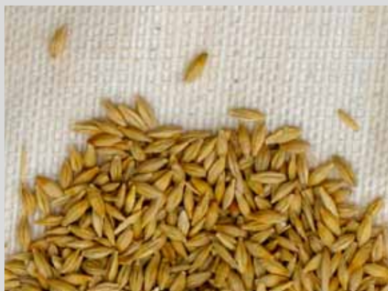
ЗЕРНО ПЕРЕД ПЛЮЩЕНИЕМ