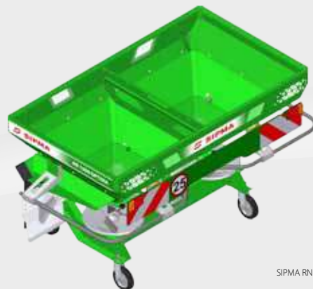
SIPMA RN 1000 OPTIMA

оборудованные двумя парами лопаток, позволяют вносить удобрения с шириной рассеивания 10 - 24 м, 18 - 32 м.