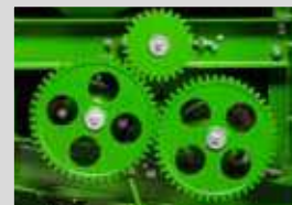
ЗУБЧАТЫЕ КОЛЕСА (СЕРИЯ TYTAN)