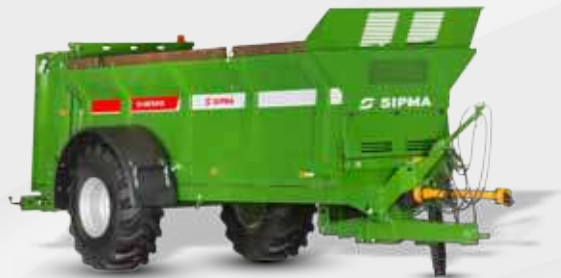
SIPMA RO 1000 TAJFUN