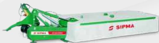
SIPMA KD 2620 SPRINT

Дисковые задние косилки с боковой навеской SIPMA KD 2620 SPRINT и SIPMA KD 3020 SPRINT это современные косилки с легкой и простой конструкцией.