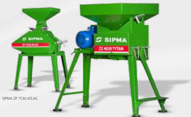
SIPMA ZP 7530 ATLAS

SIPMA ZZ 4020 TYTAN SIPMA ZZ 7520 TYTAN SIPMA ZZ 7530 TYTAN