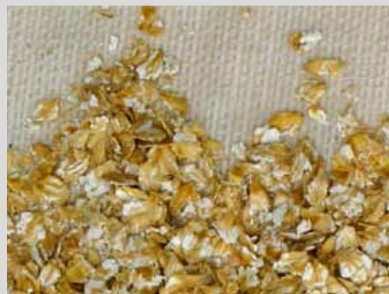
ЗЕРНО ПОСЛЕ ПЛЮЩЕНИЯ ЗЕРНОПЛЮЩИЛКОЙ SIPMA