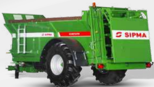
SIPMA RO 800 TAJFUN

SIPMA RO 600 TAJFUN, SIPMA RO 800 TAJFUN и SIPMA RO 1000 TAJFUN, это машины предназначенные для разбрасывания навоза, торфа, компоста и куриного помета и извести. После демонтажа адаптера могут так же использоваться для транспортировки сельскохозяйственных продуктов. Они работают с тракторами, оборудованными нижним транспортным крючком типа „фаркоп” и полностью адаптированы для передвижения по дорогам общего пользования.