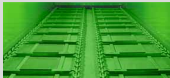
ДВОЙНОЙ НАПОЛЬНЫЙ КОНВЕЙЕР

обеспечивает безопасный обзор загрузочного кузова.